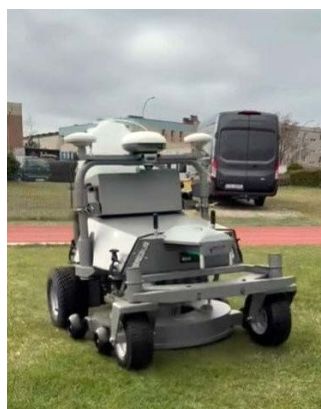
fol. MOSiR Reda