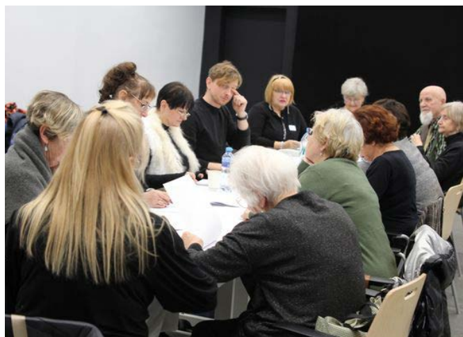
„Grupa teatralna Reda” zaczyna próby do nowego projektu. Pierwsze czytanie scenariusza. Premiera czerwiec 2025.