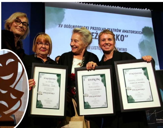
Kolorowy Team z „Kurrewolucją” na XV Ogólnopolskim Przeglądzie Teatrów Amatorskich „Wieżowisko” w Gniewinie. Grupa przywiozła Wyróżnienie, Statuetkę i nagrodę pieniężną.