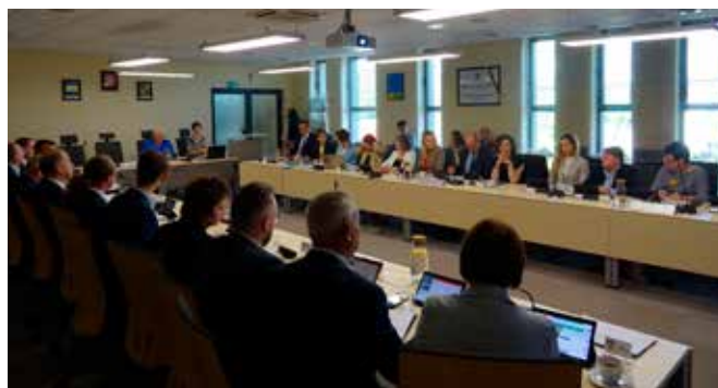
fol. UM Reda