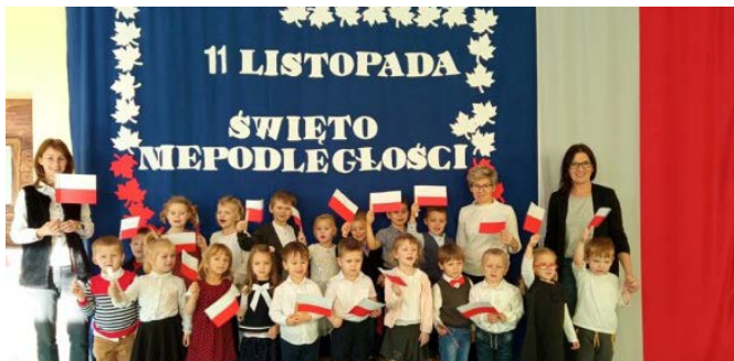
fol. M. Pacler

Na początku listopada odwiedził nas teatrzyk Qufer z przedstawieniem „Legenda o białym orle”. Dzieci z zainteresowaniem oglądały występ aktorów. Poznały legendę o początkach dziejów Polski i założeniu pierwszej stolicy Polski - Gniezna.