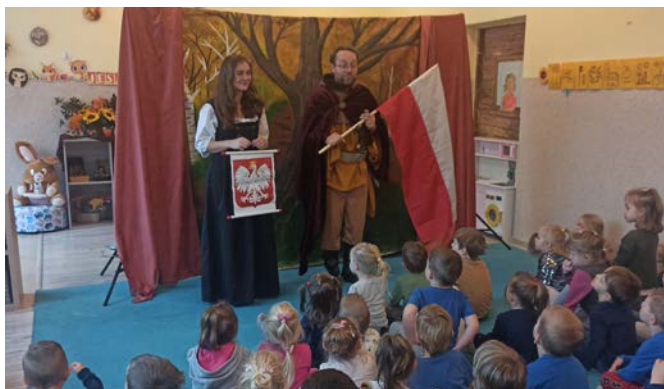
fol. A. Ulenberg

Jak co roku o tej porze, 29 października w Przedszkolu nr 1 odbyło się uroczyste przyłączenie dzieci do społeczności przedszkolnej, a mianowicie „Pasowanie na Przedszkolaka” najmłodszej grupy trzylatków. Tego dnia Motylki po raz pierwszy miały okazję zaprezentować swoje zdolności wokalne - taneczne. Zwieńczeniem imprezy było obdarowanie dzieci dyplomami, upominkiem i słodkim poczęstunkiem, oraz wykonanie wspólnego, pamiątkowego zdjęcia.