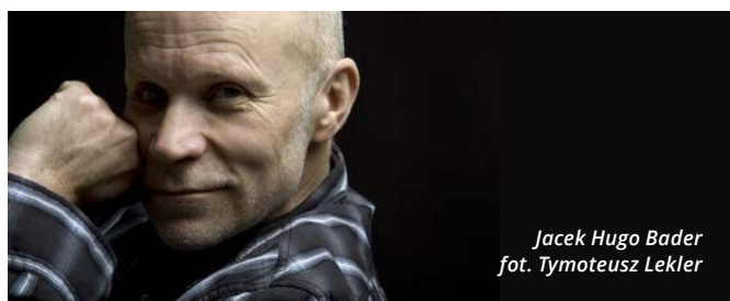
Jacek Hugo Bader

24 września o godz. 18:00 w Fabryce Kultury odbędzie się spotkanie z Jackiem Hugo-Baderem – dziennikarzem i reportażystą. W jego dorobku szczególnie popularne są reportaże z Rosji i innych krajów byłego Związku Radzieckiego.