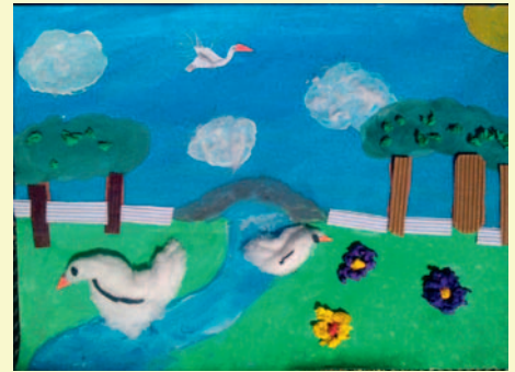
Zuzanna Podolska, kl. III, SP 6 „Kocham Redę za wzgórza pełne różnorodnych drzew i rzekę Redę płynącą przez miasto. Za park, zielen i rabaty pełne kwiatów. Chciałabym zawsze tu mieszkać.”