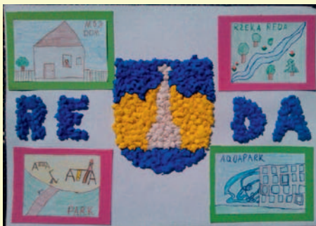
Marcelina Malottki, kl. III, SP 3 „Kocham Redę za aquapark, za rzekę Reda, za to, że możemy tutaj mieszkać, za park w Redzie, za przyjaciół, których tu poznałam.”