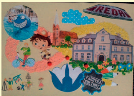
III miejsce. Kacper Klaman, kl. II, SP 5

„Kocham Redę za festyny, zabawy i za krajobraz ciekawy.”