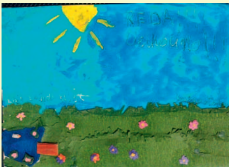
Zofia Zocholl, kl. III, SP 3 „Kocham Redę za łąki, piękno i za to, że się rozwija.”