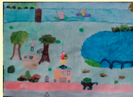
III Miejsce: Wiktoria Zaremba, kl. III, SP 2

„Kocham Redę za piękno natury, cuda architektury i ciekawą działalność Fabryki Kultury.”