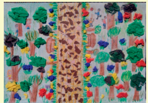
Martyna Bobrowska, kl. III, SP 2 „Kocham Redę za piękny park.”