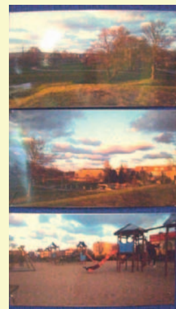
III Miejsce: Wiktoria Makowska, kl. VI, SP 2

„Kocham Redę za piękne miejsca wypoczynku.”