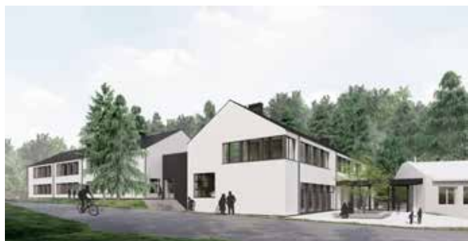
Wizualizacja SP 5 po rozbudowie

Na pierwszym piętrze przewidziano 6 sal lekcyjnych wyposażonych w niezbędne zaplecze, bibliotekę z antresolą i pomieszczenia socjalne. Obie części są połączone łącznikiem, gdzie znajduje się wejście do budynku szkoły.