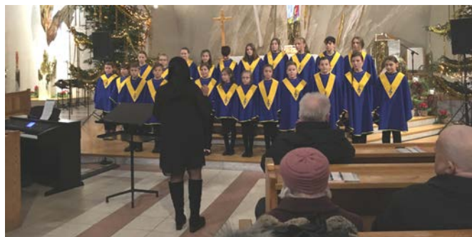
fot. archiwum SP 2