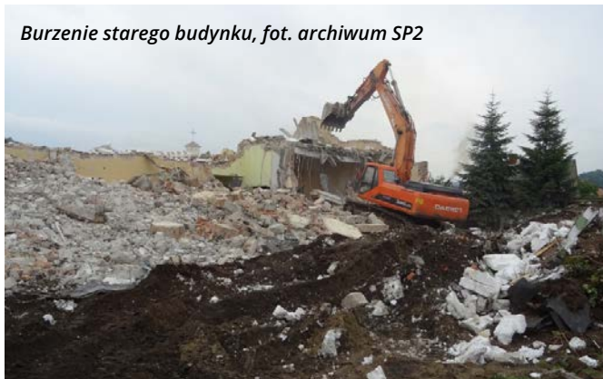
Burzenie starego budynku, fot. archiwum SP2

Budowa nowego budynku Szkoły Podstawowej nr 2 idzie zgodnie z planem. Obecnie obiekt jest już w stanie surowym zamkniętym. Z tej okazji na dachu zawisła wiecha.