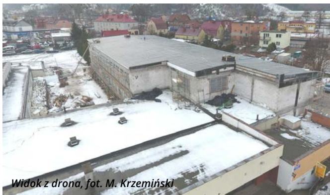
Widok z drona

W SP 2 spotkali się wykonawcy – ekipa budowlana firmy „DACHBUD”, radni, reprezentacja Rady Rodziców oraz przedstawiciele Urzędu. Rozbudowa szkoły rozpoczęła się w lipcu ubiegłego roku. W nowym skrzydle znajdzie się szesnaście sal lekcyjnych wraz z zapleczem socjalnym i gospodarczym. Obiekt będzie nie tylko funkcjonalny, ale i dostosowany do potrzeb uczniów, w tym do potrzeb osób niepełnosprawnych. W każdej z sal lekcyjnych zapewni się dostęp do multimedialnych.