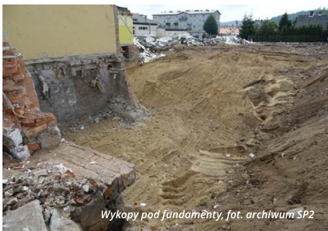
Wykopy pod fundamenty

W SP 2 spotkali się wykonawcy – ekipa budowlana firmy „DACHBUD”, radni, reprezentacja Rady Rodziców oraz przedstawiciele Urzędu. Rozbudowa szkoły rozpoczęła się w lipcu ubiegłego roku. W nowym skrzydle znajdzie się szesnaście sal lekcyjnych wraz z zapleczem socjalnym i gospodarczym. Obiekt będzie nie tylko funkcjonalny, ale i dostosowany do potrzeb uczniów, w tym do potrzeb osób niepełnosprawnych. W każdej z sal lekcyjnych zapewni się dostęp do multimedialnych.